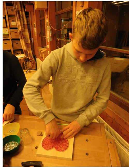
Pomocí barevných bavlnek hustě vyplétáme vzor obrázku. Na konci bavlnku přivážeme k hřebíku a zakápneme lepidlem.