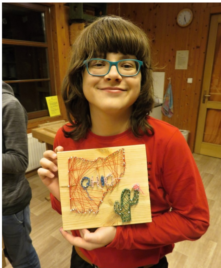
Obrázek lze vyplétat různými barvami. Je potřeba si předem rozmyslet, zda budou vedle sebe nebo nad sebou a v jakém pořadí.