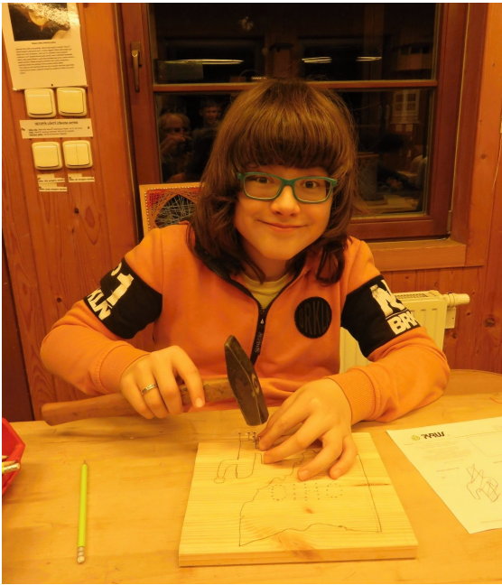
Po obvodu předkresleného obrázku v pravidelných rozstupech zatlučeme hřebíčky.